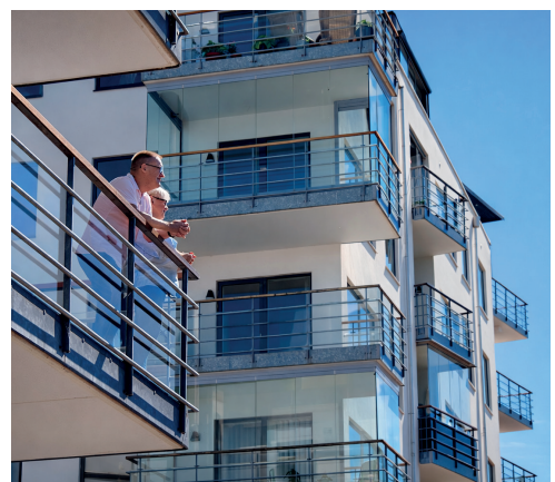
Foto framsida: Bygget av HSB brf Handelsmannen i Glumslöv Foto sida 2: HSB brf Parkhusen, HSB-personalen, HSB under "Sommar i Landskrona" och HSB brf Öresund